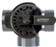
263028 • 3 vías 2" x 2½" PVC 263037 • 3 vías 1½" x 2" PVC