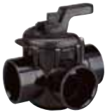
263026 • 3 vías 2" x 2½" CPVC 263035 • 3 vías 1½" x 2" CPVC

Las válvulas Pentair ofrecen un rendimiento confiable y económico, sin requerir lubricación. Diseñadas para una larga vida, con un desempeño superior al de otras válvulas más caras de otros fabricantes. Solicite los precios a su representante de ventas.