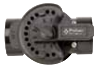
263027 • 2 vías 2" x 2½" CPVC 263036 • 2 vías 1½" x 2" CPVC