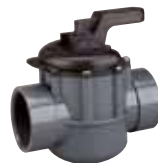
263029 • 2 vías 2" x 2½" PVC 263038 • 2 vías 1½" x 2" PVC